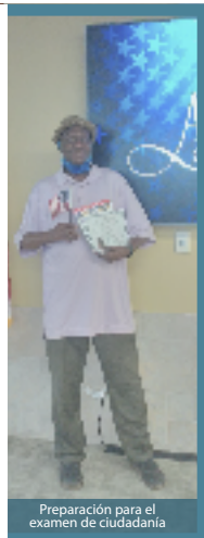
Preparación para el examen de ciudadanía