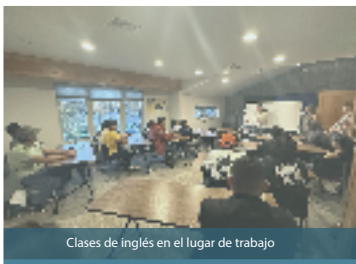
Clases de inglés en el lugar de trabajo