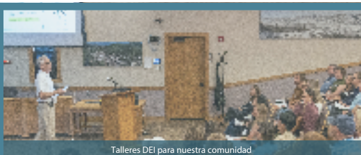
Talleres DEI para nuestra comunidad