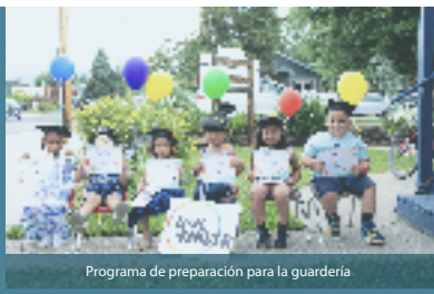
Programa de preparación para la guardería